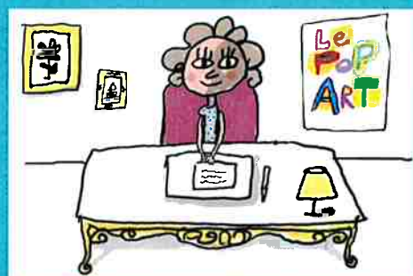
...mais pas quand je suis seul(e) dans mon bureau!