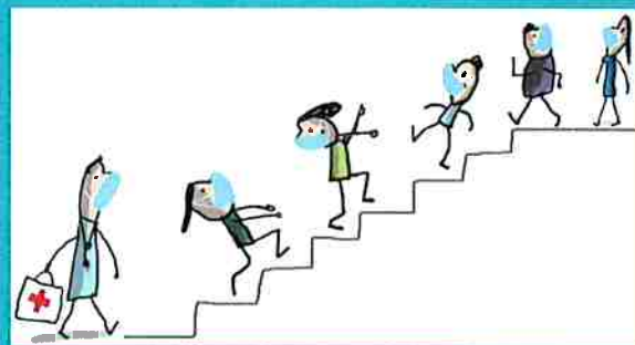
dans les escaliers