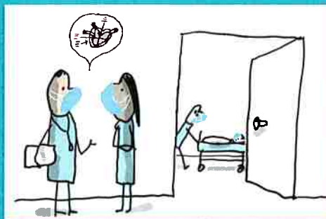
dans les services