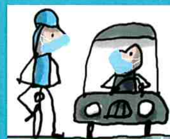
dans les sous-sols