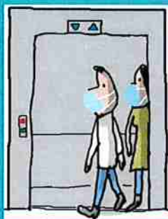
dans les ascenseurs