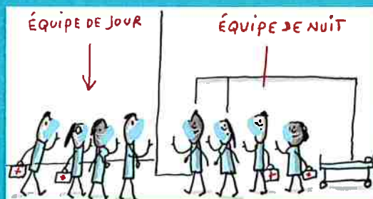
dans les couloirs