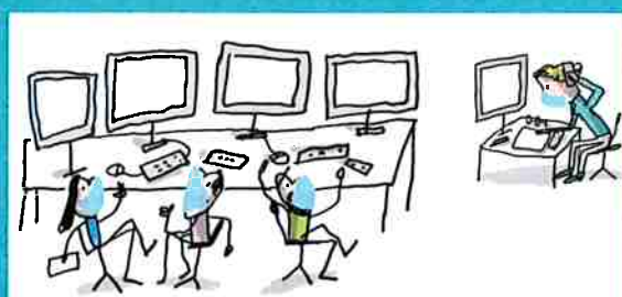
dans les bureaux