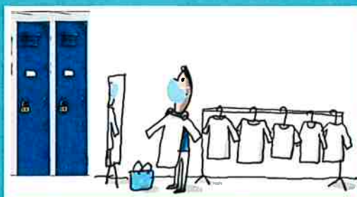
dans les vestiaires