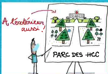
dès l'entrée aux HCC